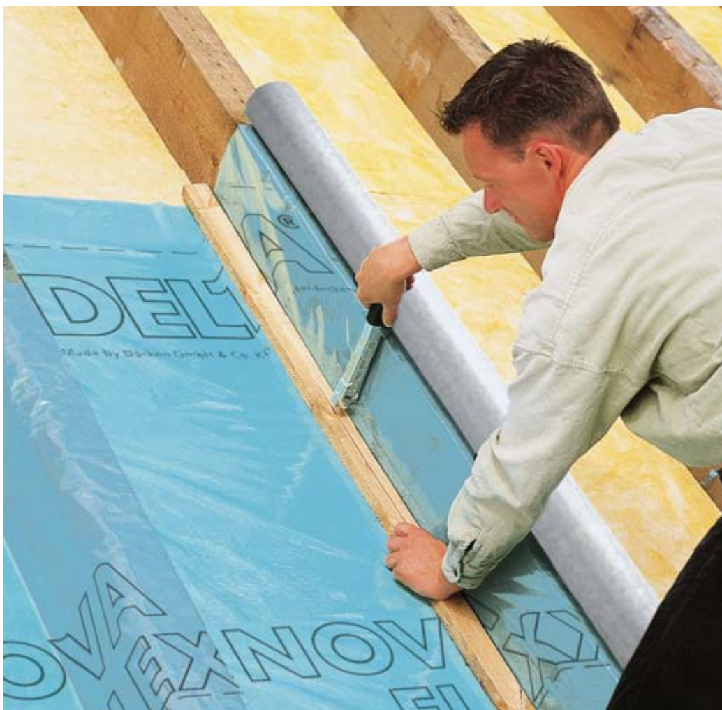
DELTA®-NOVAFLEXX ist schnell und kostensparend über den Sparren ausgerollt.