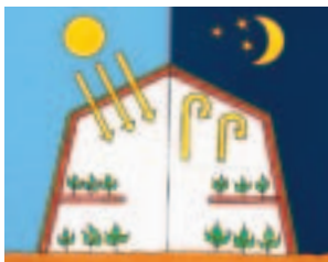
Jederzeit stabiles Klima.